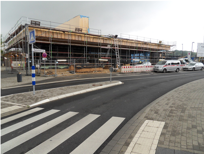
Das im Bau befindliche neue Bahnhofsgebäude in Horrem (2013)