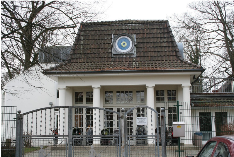
RWTH Kinderkrippe, Melatener Str. 39 in Aachen