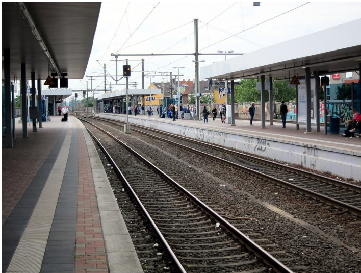
Bahnsteige und Gleiskörper des Bahnhofs Köln-Ehrenfeld (2015)