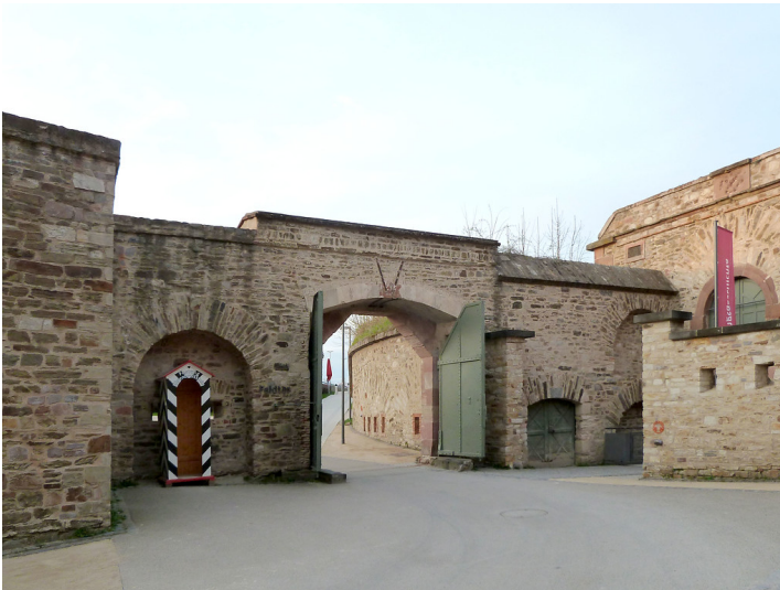
Festung Ehrenbreitstein, Feldtor (Hauptzugang) (2017)