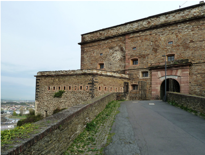
Festung Ehrenbreitstein, Südlicher Abschnitt (2017)