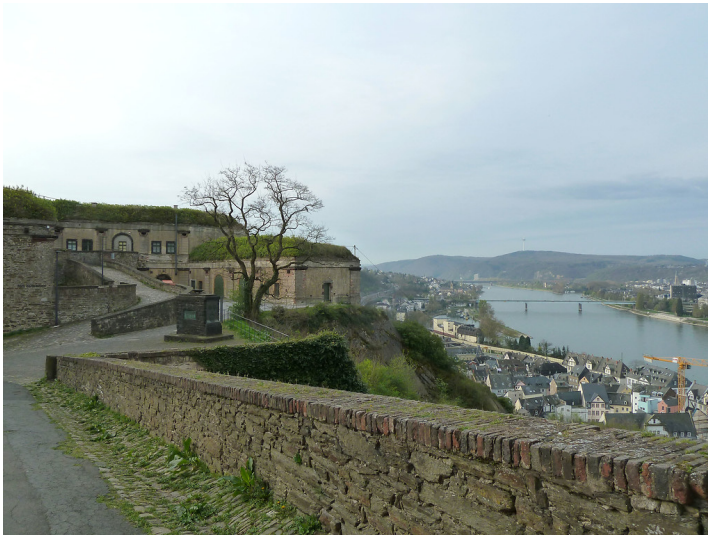
Festung Ehrenbreitstein, Felsenweg und Fort Helfenstein (2017)