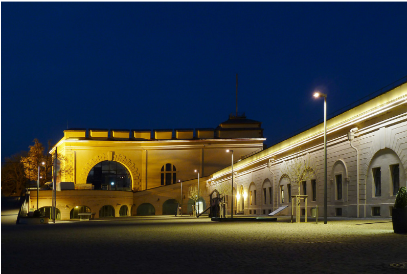
Festung Ehrenbreitstein, große Traverse und Niedere Ostfront (2017)