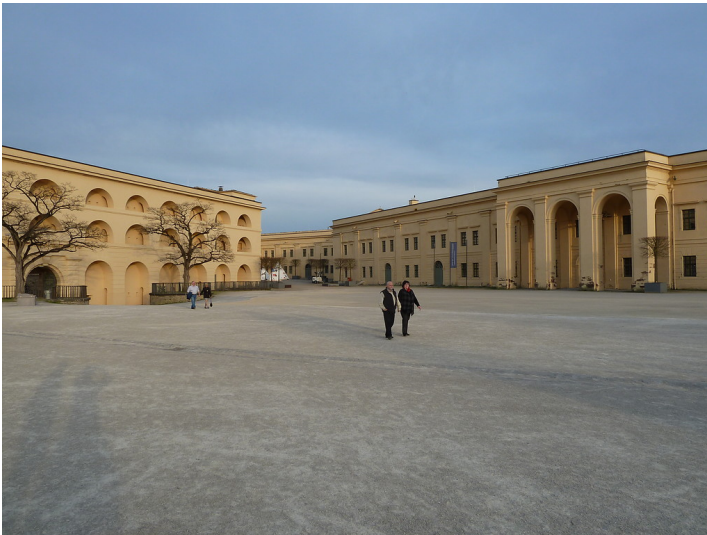
Festung Ehrenbreitstein, Oberer Schlosshof (2017)