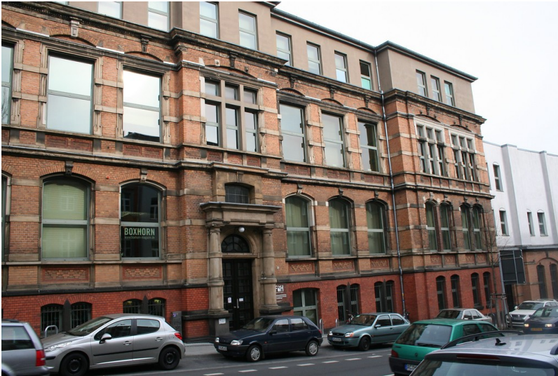
Fachhochschule für Design, Boxgraben 100, Aachen