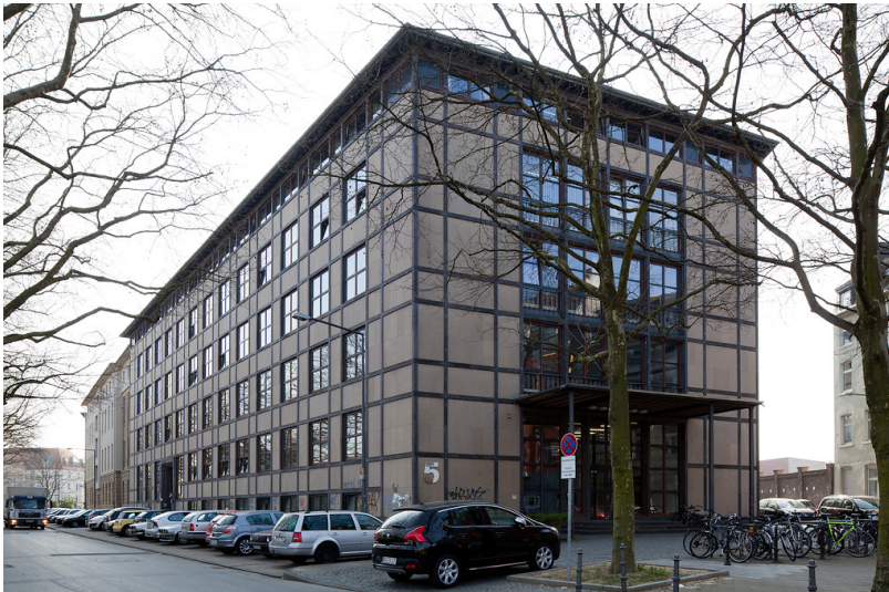
RWTH Gießerei-Institut, Intzestr. 5 in Aachen