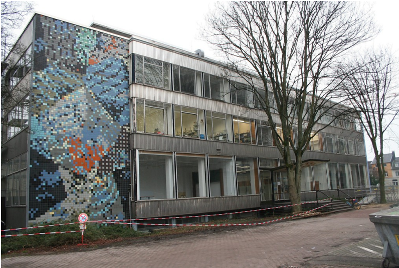
Das RWTH Institut für Werkstoffkunde (2011).