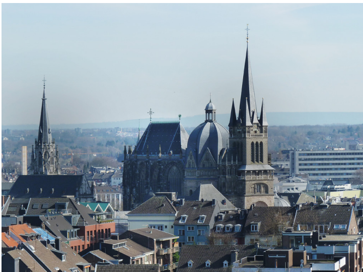
Aachener Dom (2011)