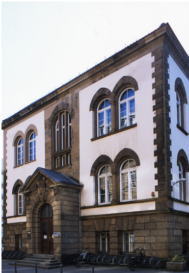
Die Alte Bibliothek der RWTH Aachen, Wüllnerstraße 3, in Aachen (2011).