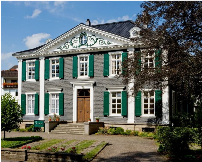
Pulvermuseum Wipperfürth