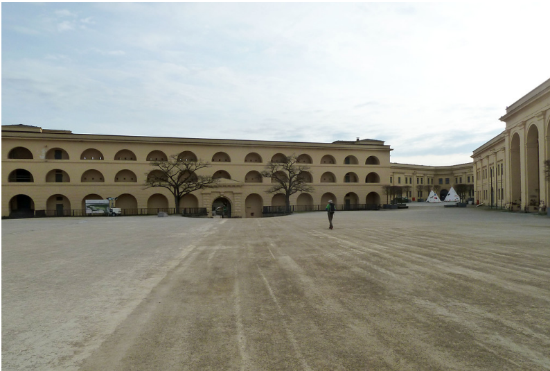
Festung Ehrenbreitstein, Oberer Schlosshof, Kurtine und der Wachportikus (2017)