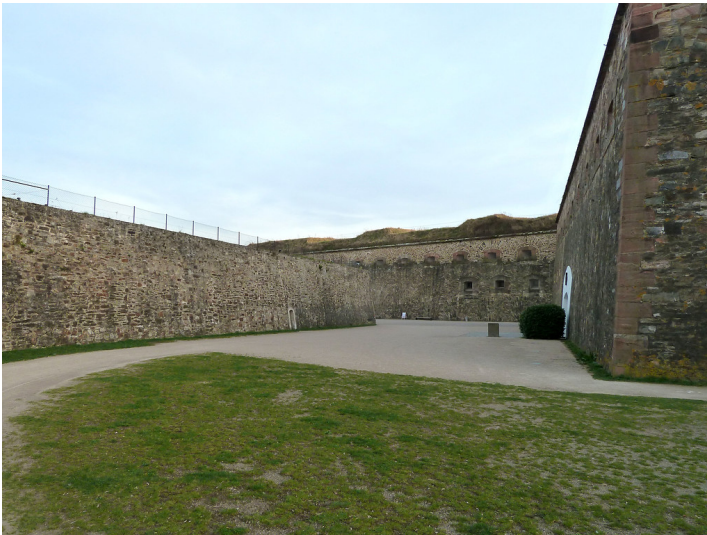
Festung Ehrenbreitstein, Hauptgraben, Contregarde, Grabentor und Ehrenmal des Deutschen Heeres im Ravelin (2017)