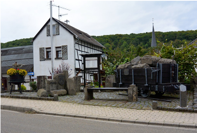
Dorfplatz in Remagen-Unkelbach mit einer Lore aus dem nahen Steinbruchbetrieb und einer Weinpresse (2014)