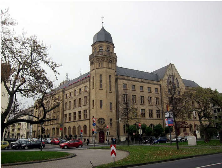
Ehem. Kaiserliche Oberpostdirektion am Friedrich-Ebert-Ring in Koblenz (2014)