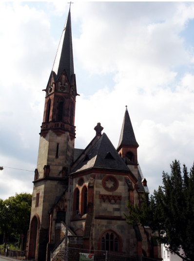
Evangelische Christuskirche in Pfaffendorf in Koblenz (2014)