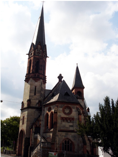
Evangelische Christuskirche in Pfaffendorf in Koblenz (2014)