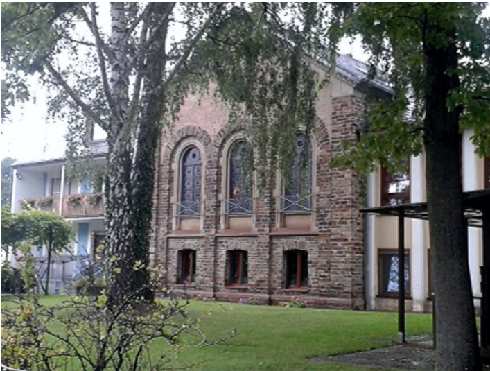
Westansicht der evangelischen Lutherkapelle in Horchheim in Koblenz (2014)