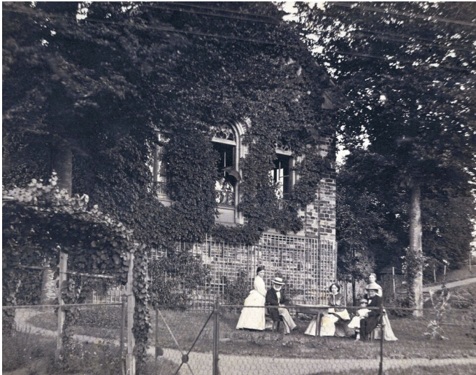
Das Teehaus in Koblenz-Horchheim mit Mitgliedern der Familie Mendelssohn (um 1880)