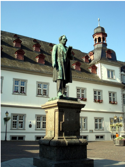
Johannes-Müller-Denkmal auf dem Jesuitenplatz vor dem Koblenzer Rathaus in der Koblenzer Altstadt (2014)