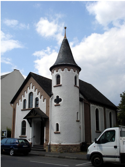
Evangelische Zieglerkirche in Metternich in Koblenz (2014)