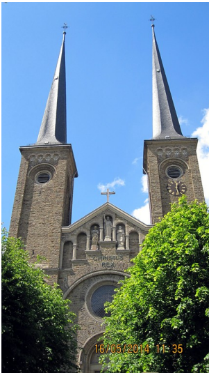
Teilansicht der neuen St. Servatiuskirche in Koblenz-Güls (2014)