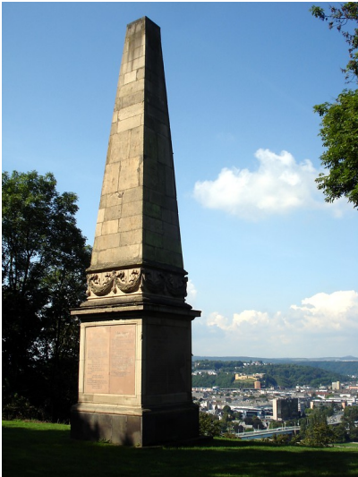
Kriegerdenkmal (Obelisk) für die Gefallenen Soldaten des Feldzuges von 1866 in Asterstein in Koblenz (2014)