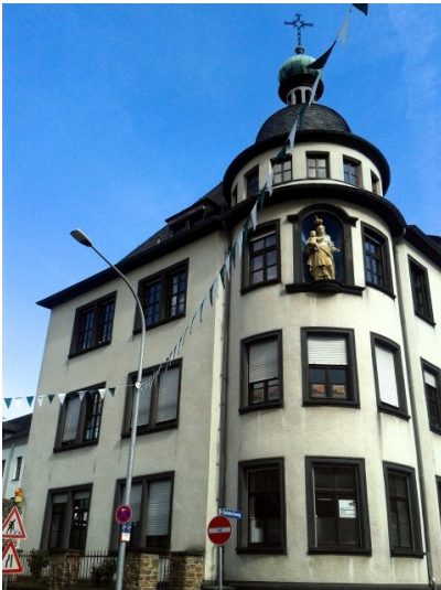
Der westliche Teil des ehemaligen Klosters der Salesianerinnen in Moselweiß in Koblenz (2014)