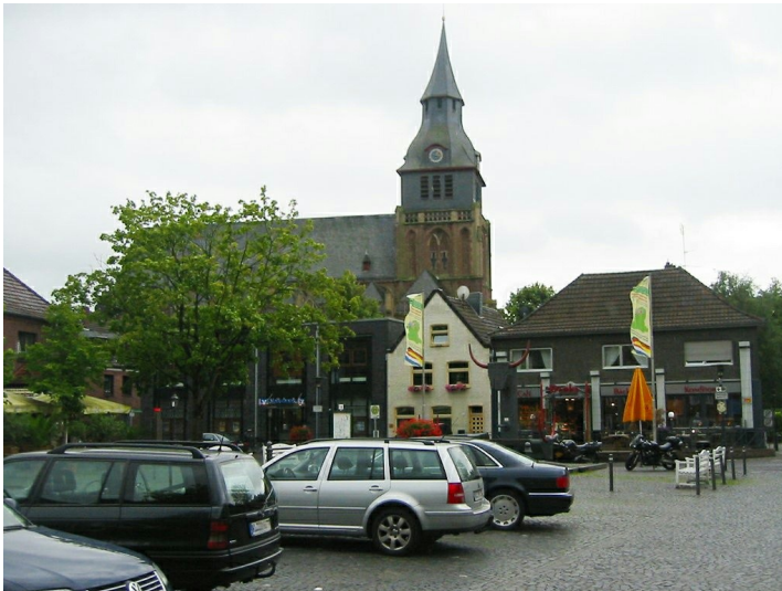
Die Pfarrkirche St. Peter und Paul in Kranenburg (2009).