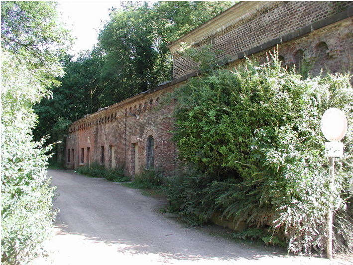
Erhaltener Teil des Fort VI (Deckstein) des äußeren preußischen Festungsgürtels in Köln-Lindenthal (2006).