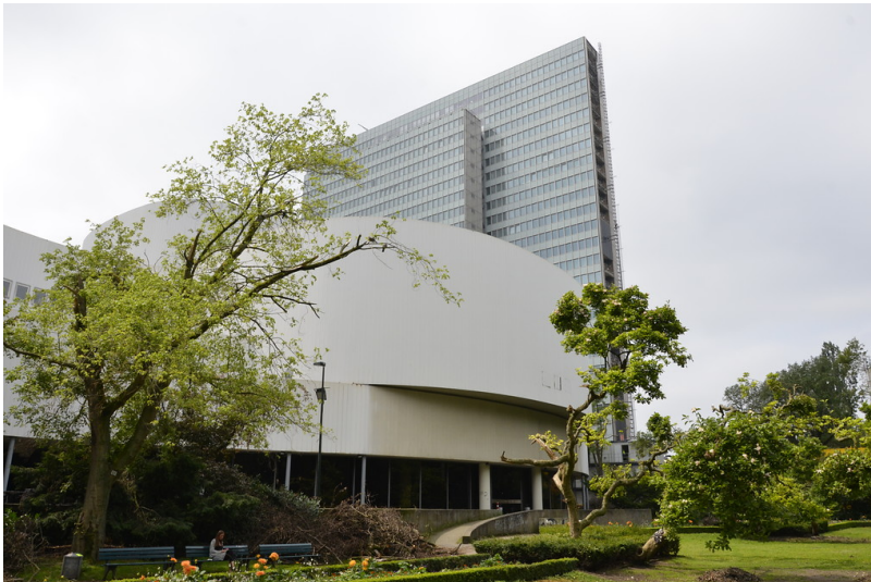
Das Schauspielhaus vor dem Dreischeibenhaus in Düsseldorf. Auch die Sturmschäden (Unwetter vom 9. Juni 2014), die den Hofgarten stark getroffen haben, sind deutlich zu erkennen (Aufnahme vom Juli 2014).