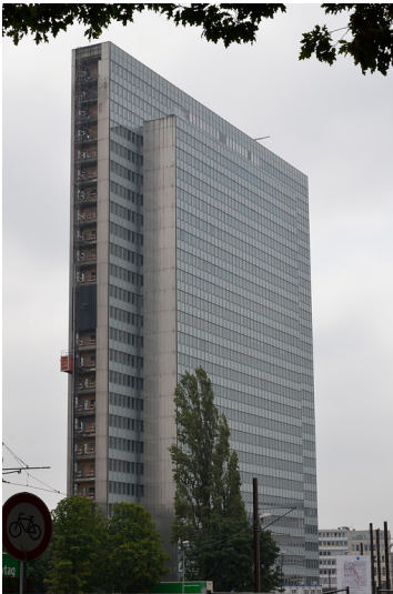
Dreischeibenhaus in Düsseldorf. Es beheimatete bis 2010 den Firmensitz von Thyssen Krupp. Auch weiterhin soll es als Bürogebäude genutzt werden. Zum Zeitpunkt der Aufnahme (Juli 2014) wird es gerade saniert.