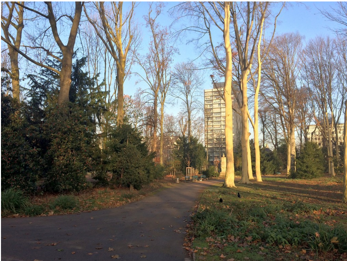
Hofgarten in Düsseldorf (2016)