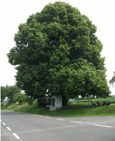
Winterlinde ( Tilia cordata ) am Heiligenhäuschen bei Windeck-Gerressen (2013).