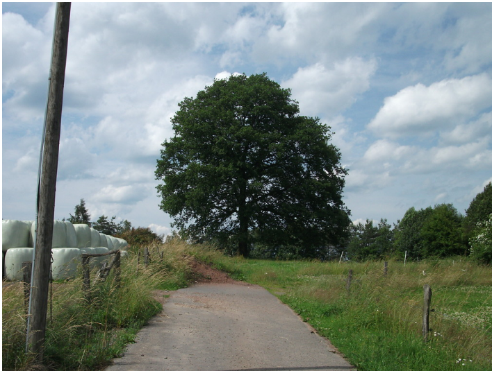
Die landschaftsbildprägende Stieleiche (' Quercus robur ') an der Kreisstraße 7, nördlich von Windeck-Saal (2013).