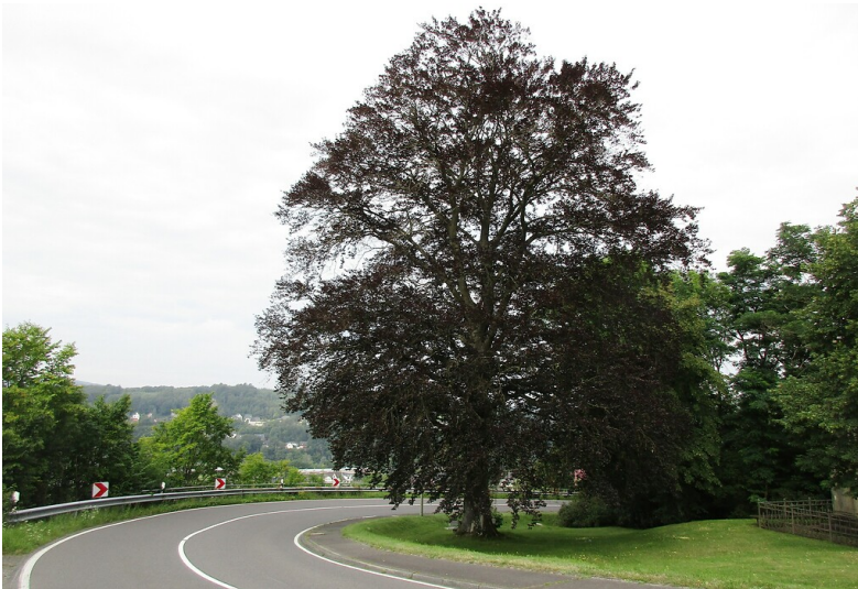
Die orts- und landschaftsprägende Blutbuche "Am Denkmal" in Windeck-Rosbach (2021).