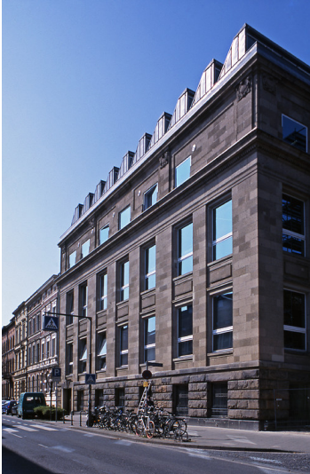
Das Reiffmuseum in der Schinkelstraße in Aachen