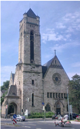
Evangelische Christuskirche in Koblenz-Mitte (2014)