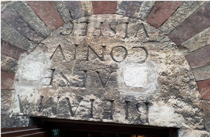
Auf dem Kopf stehend vermauerte Spolie eines römischen Grabsteins als Tüersturz am Trierer Wohnturm Frankenturm (2017).