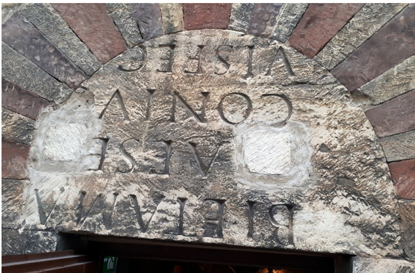
Auf dem Kopf stehend vermauerte Spolie eines römischen Grabsteins als Türsturz am Trierer Wohnturm Frankenturm (2017).