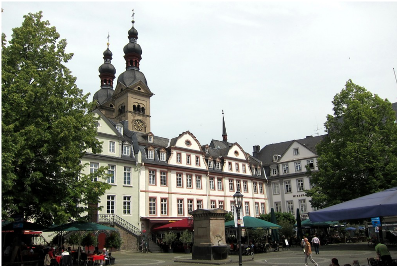
Blick auf den Platz "Am Plan" in der Koblenzer Altstadt (2014)