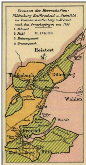
Karte: "Grenzen der Herrschaften: Wildenburg, Reifferscheid u. Steinfeld, bei Tiefenbach, Gillenberg u. Kreckel nach den Grenzbegehungen von 1785.". Ausschnitt aus der "Karte der politischen und administrativen Eintheilung der heutigen preussischen Rheinprovinz für das Jahr 1789" (Geschichtlicher Atlas der Rheinprovinz von Wilhelm Fabricius, Blatt V, Wetzlar, 1894). Fotograf/Urheber: Wilhelm Fabricius