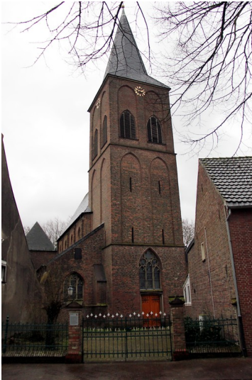
Pfarrkirche in Kalkar-Grieth (2015)