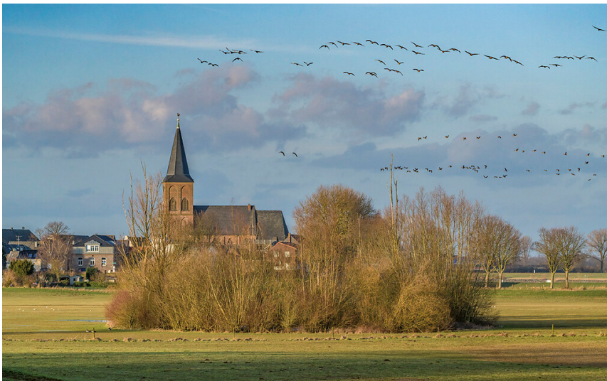
Grieth bei Kalkar (2020)