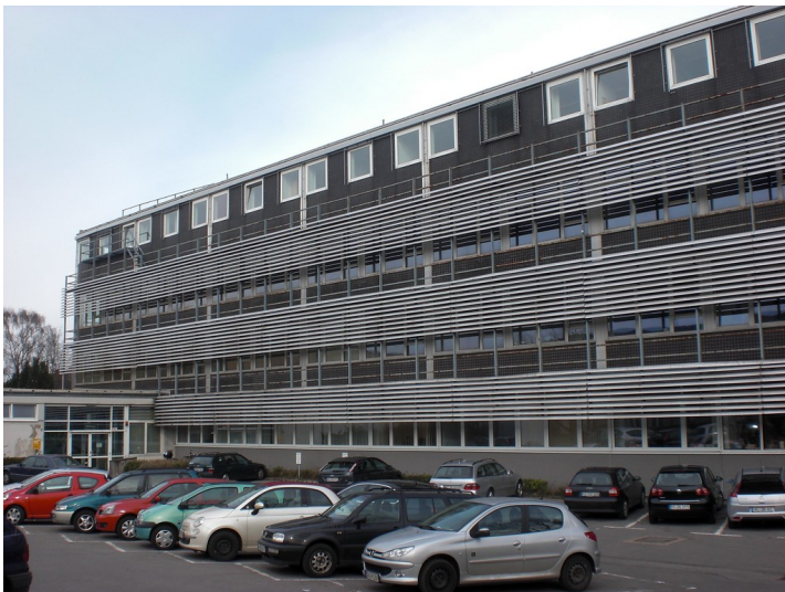
RWTH Sammelbau (ehemalige Pädagogische Hochschule), Ahornstraße 55 in Aachen, Hauptgebäude (2011).