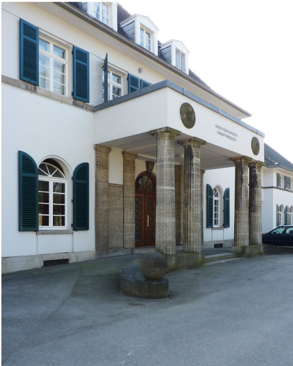
RWTH Gästehaus Königshügel