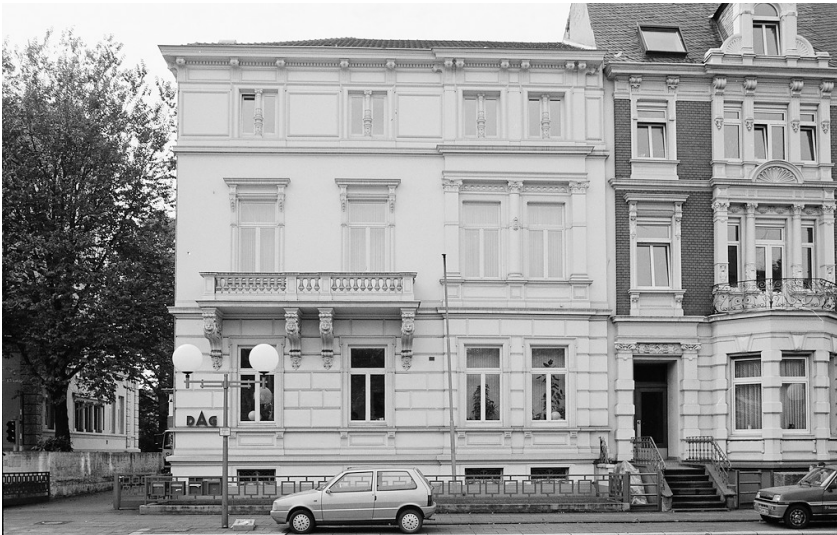
Wohnhaus Adenauerallee 118 in Bonn (1999)