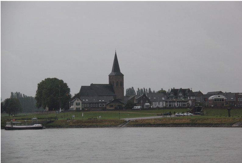
Das ehemalige Städtchen Grieth am Rhein, heute Stadtteil Kalkar-Grieth im Kreis Kleve (2014).