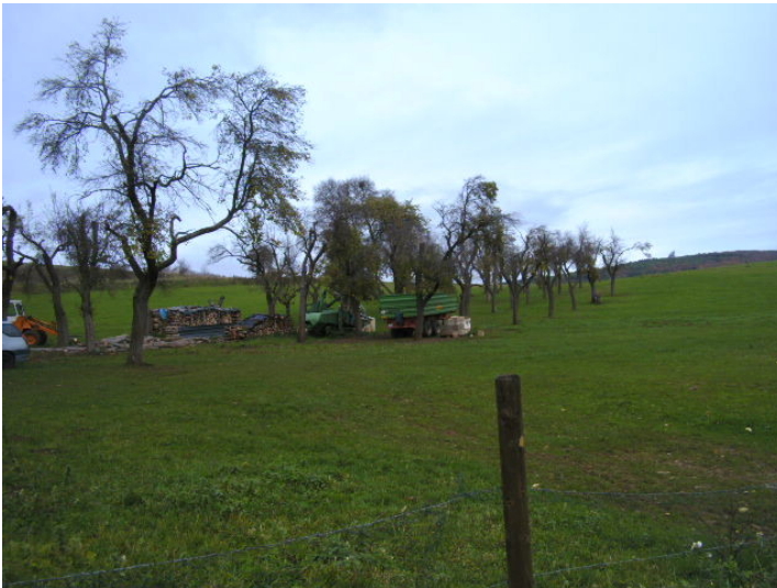
Alte Streuobstwiese in Bad Münstereifel-Gilsdorf (2013)