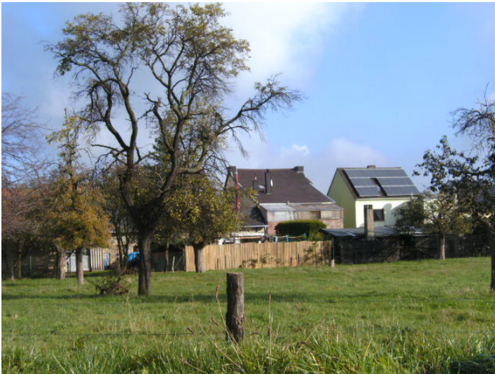
Alte Streuobstwiese in Bad Münstereifel-Arloff (2013)