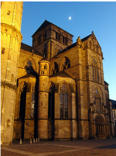
Abendliche Ansicht der Liebfrauenkirche Trier (Liebfrauen-Basilika) vom Domfreihof aus (2014).