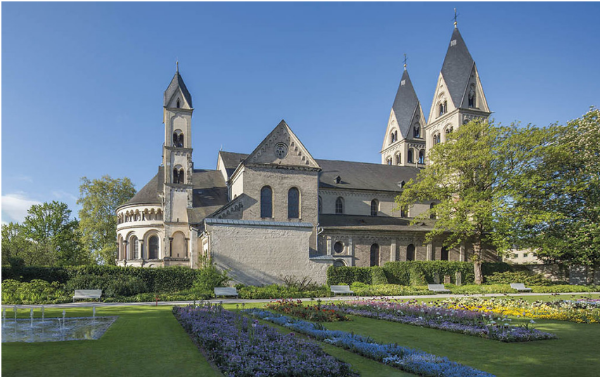
St. Kastor in Koblenz (2019)