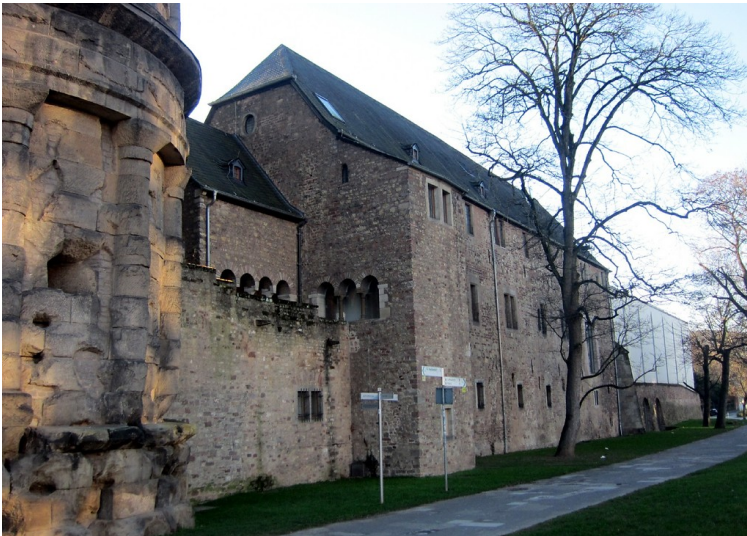
Simeonsstift (Kanonikerstift St. Simeon) in Trier, Ansicht des Nordflügels von der Nordallee aus (2014).